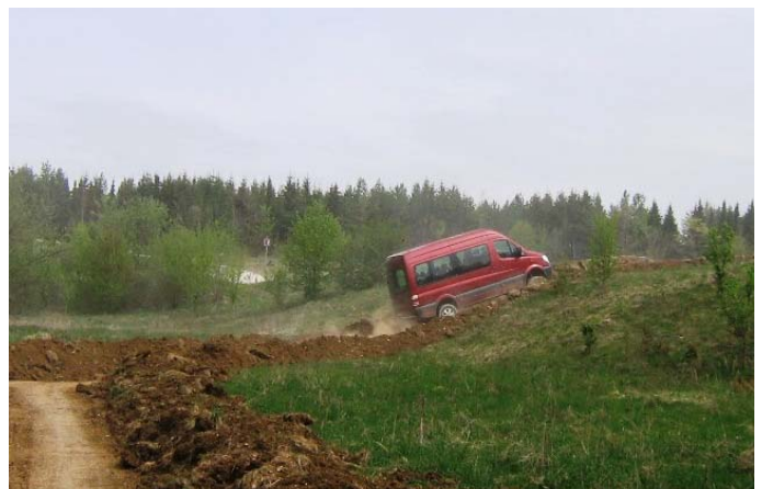
Mit dem Sprinter auf der Geländestrecke