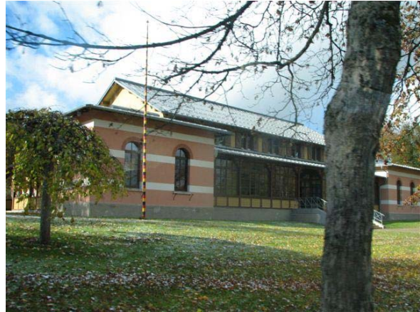
Ansicht des Offiziers Kasino