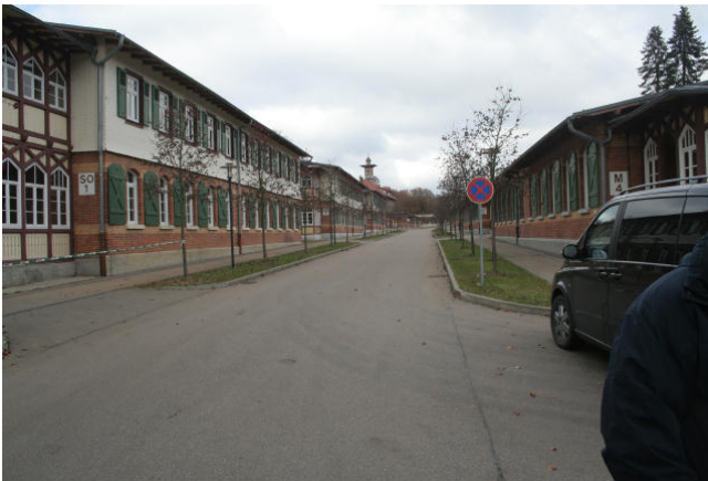
Ansicht des innern Einfahrtbereiches »Altes Lager«

Brauner Beschilderung » Altes Lager« folgen.