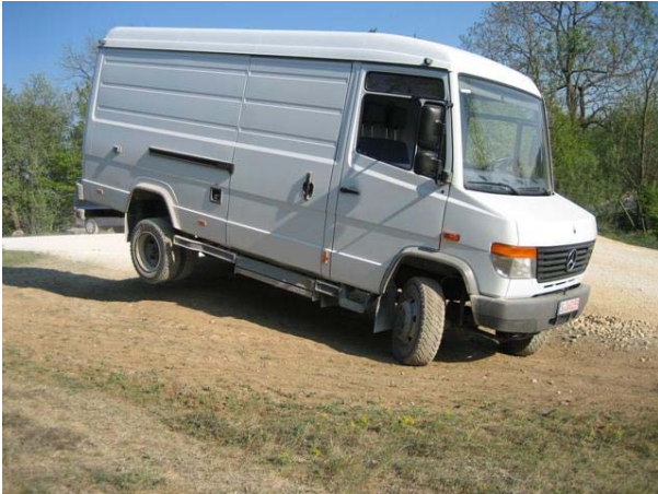
Auch schweres Gerät kann fliegen