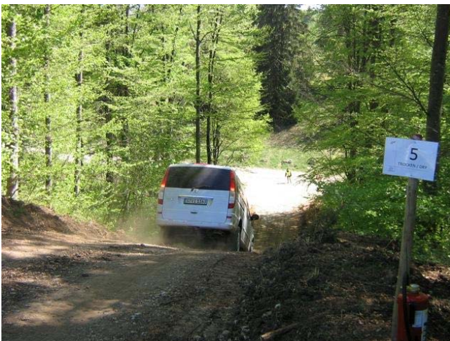
W639 auf 50% Gefällstrecke