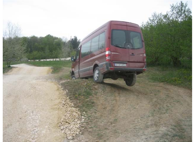
NCV3 mit eingeschränkter Bodenhaftung