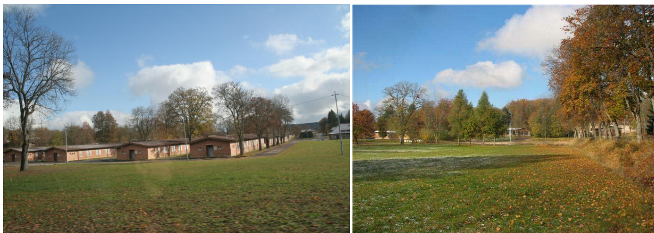
Unser Bereich für die kommenden Tage

Treffen Münsingen findet auf dem ehemaligen Truppenübungsgelände > Münsinger Hardt < statt. Wir sind im Herzen des > Alten Lagers< untergebracht. Bei dem V-Platz handelt es sich um eine 3 Hektar große Fläche. Die Vans können nach Platzvergabe dort aufgestellt werden.