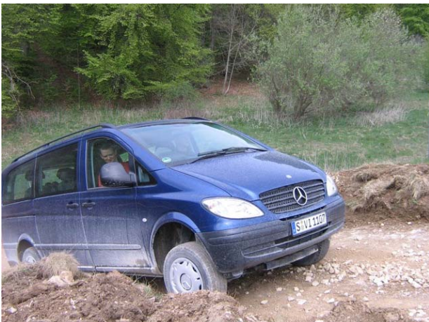
Mit dem W639 Vito 4x4 im Offroad Parcours

Einlass für Teilnehmer erst ab 16:00 Uhr am Haupttor möglich.